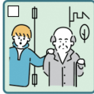
目を離せない家族の見守りや声かけなどの気づかいをしている