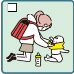
家族に代わり、幼いきょうだいの世話をしている