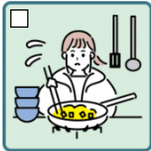
障がいや病気のある家族に代わり、買い物・料理・掃除・洗濯などの家事をしている