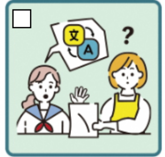
日本語が第一言語ではない家族や障がいのある家族のために通訳をしている