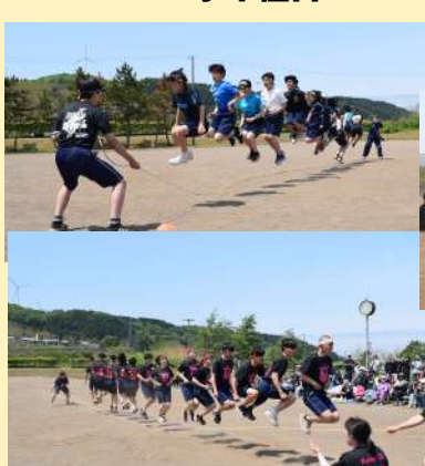
学年対抗大縄跳び 今年は3年生が優勝