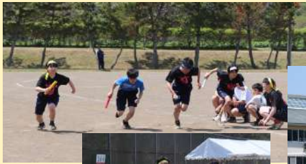
全校リレー…今年は1位赤・2位白・3位黄・4位青でした