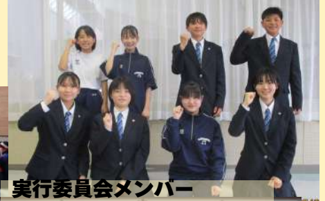
実行委員会メンバー