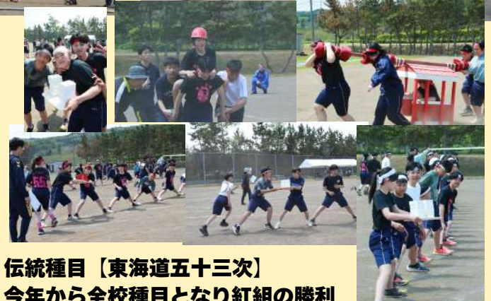
伝統種目【東海道五十三次】 今年から全校種目となり紅組の勝利