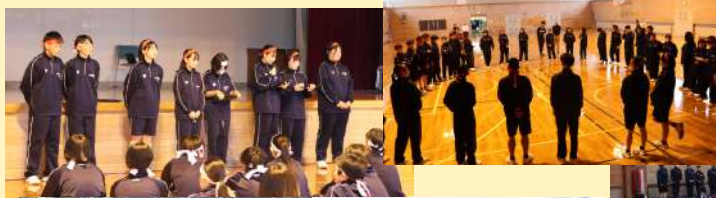
紅白分かれて集会