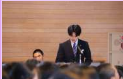
学習委員会による司会